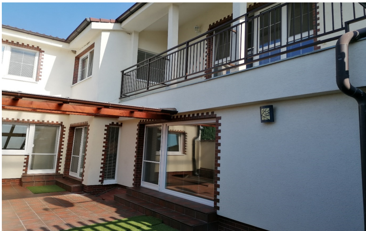
Úprava RD – výtah